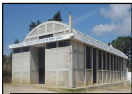
Salón Usos Múltiples