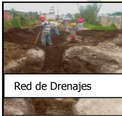
Red de Drenajes