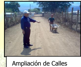
Ampliación de Calles